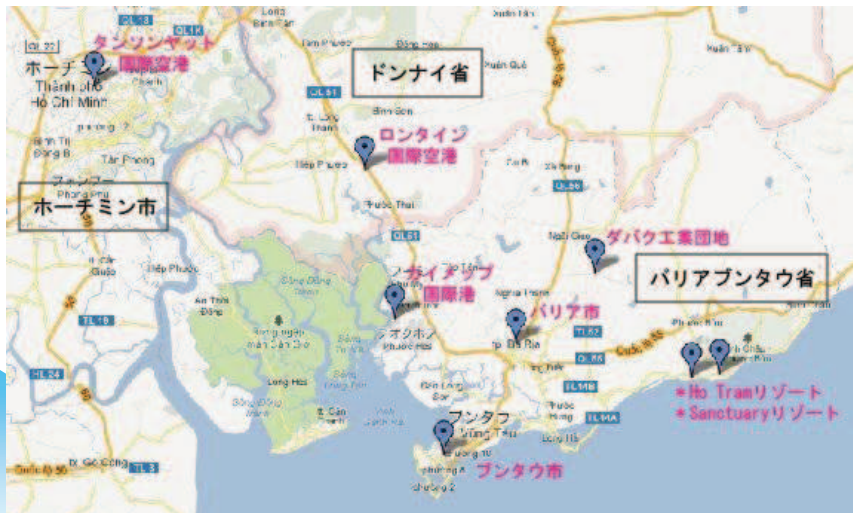
図：バリアブンタウ省周辺